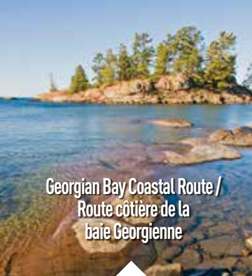
Georgian Bay Coastal Route / Route côtière de la baie Georgienne